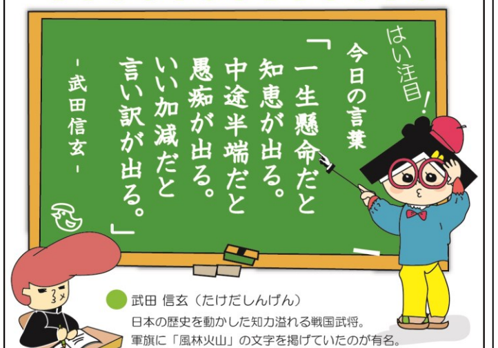
● 武田 信玄 (たけだしんげん) 日本の歴史を動かした知力溢れる戦国武将。軍旗に「風林火山」の文字を掲げていたのが有名。