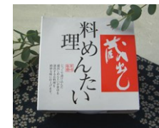
今回のお料理に使用したのは『料理めんたい』